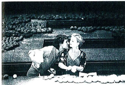
A. PACCIANI/ENGUERANDA. FONTENAY

"La pluie d'été", roman de Marguerite Duras, paru en 1990, est le prolongement en écriture d'un film, "Les Enfants" réalisé en 1984 par Duras. Éric Vigner, metteur en scène, (nouveau directeur du Centre Dramatique de Lorient), s'est emparé du roman et l'a porté à la scène avec de jeunes comédiens.