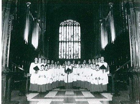
Choir of King's College Cambridge