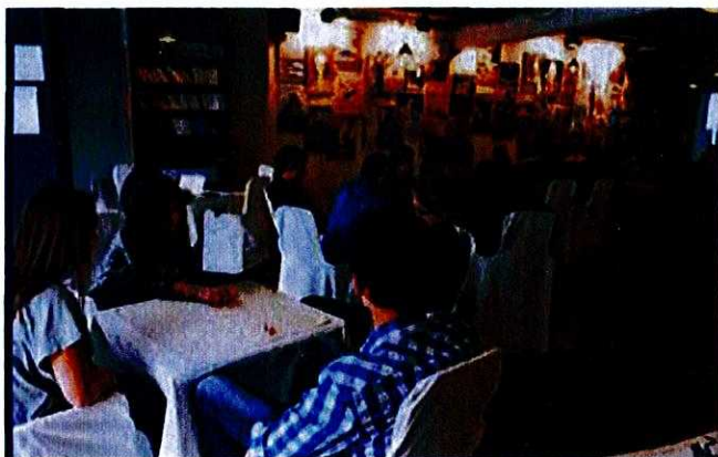
Au CDDB c'est l'heure de la pause.

dans la cour du lycée Frédéric Mistral, du 13 au 22 juillet. À Lorient, elle fera l'ouverture de saison au CDDB le 9 octobre ( Nouveau Roman ouvrira lui la saison du Grand Théâtre, dès le lendemain). Ensuite, l'Académie repartira en tournée, pour ajouter une soixantaine de dates à la presque centaine déjà faites en 2011. ▀