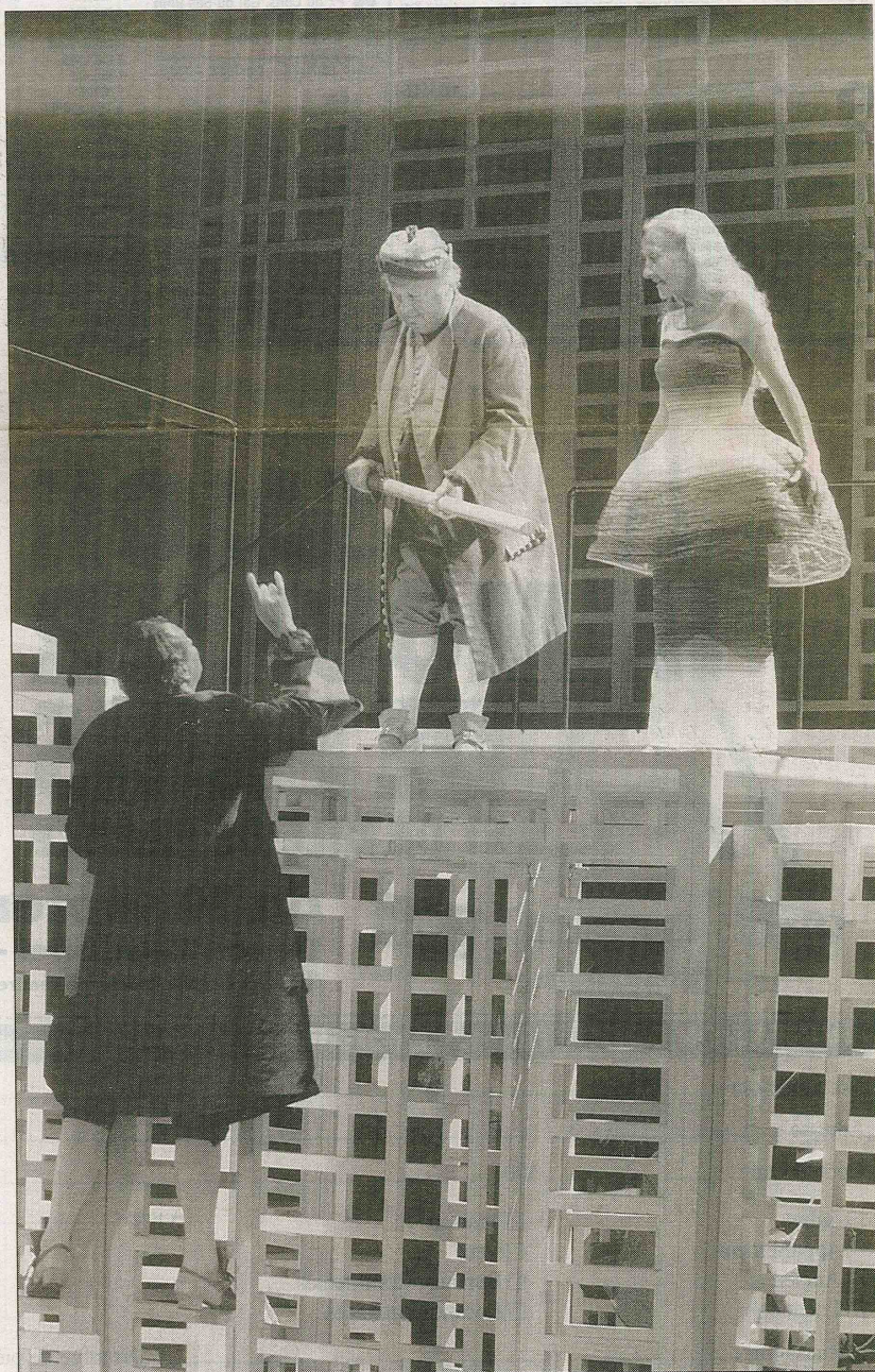
LA COMEDIE-FRANCAISE (PARIS), LE 14 SEPTEMBRE. « L'Ecole des femmes » est la première des grandes pièces de Molière.

« Dom Juan », avec Christophe Brault, Philippe Lebas, Lara Guirao, Muranyi Kovacs, Emmanuel Faventines. A partir du 1 er octobre et jusqu'au 31 octobre au Théâtre de l'Est parisien, 159, avenue Gambetta, Paris XX e . A 20 h 30 mardi, vendredi, samedi, à 19 heures mercredi et jeudi et à 15 heures dimanche. Places 90 F et 140 F. Tél. 01.43.64.80.80.