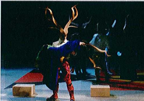
La Place Royale

Le Théâtre de Lorient présentera cette saison deux projets créés en partenariat avec des acteurs locaux : la soirée concert avec Daniel Darc et Lambchop ( 8/11 ) en partenariat avec Le festival les Indisciplinées/le manège/les studio MAPL. La soirée Zappa l'Alchimiste ( 29/01 ) en partenariat avec l'Ecole de musique et de danse de Lorient.