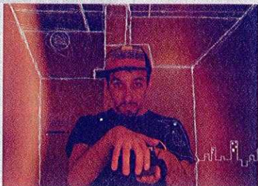
Tictac © Vlad Chirita

> Tictac , c'est une variation autour des mécanismes de la mémoire et de la superposition des souvenirs. Mais pas que... Vlad Chirita, lui aussi académicien, propose une création aux accents proustiens dans laquelle il invite d'autres académiciens.