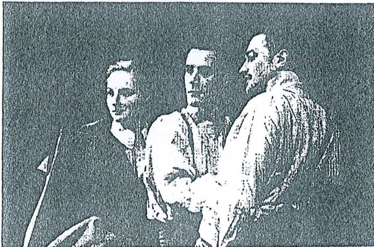
Des comédiens jeunes et prometteurs