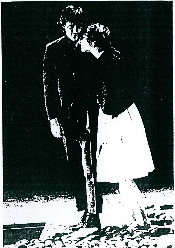
Une pièce interprétée par de jeunes comédiens issus du conservatoire de Paris.

Faites lire vos enfants. Ils vous en seront reconnaissants