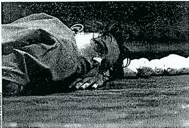
« La Pluie de l'été ». «Un cours sur l'éther... (C 2 H 5 ) 2 O.»